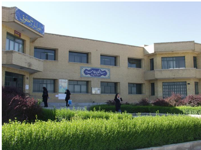
دانشکده علوم پایه (۱۵ خرداد) تاسیس ۱۳۷۶