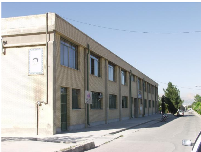
دانشکده پرستاری و مامایی تاسیس ۱۳۷۳