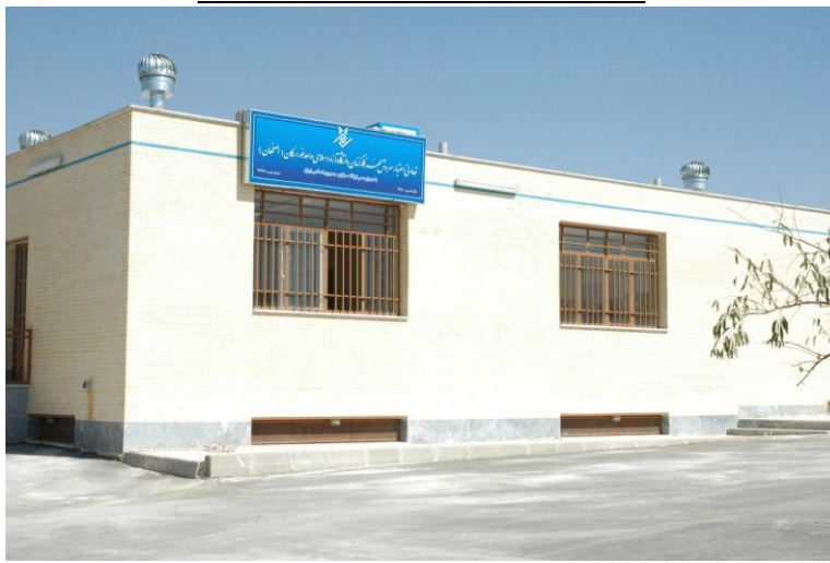
موسسه مالی و اعتباری سروش مهر تاسیس ۱۳۸۸