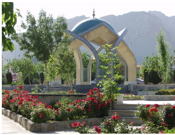
آرامگاه شهدای گمنام تاسیس ۱۳۸۴