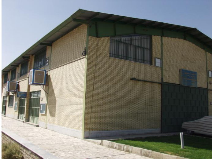
سالن آزمایشگاه های عمران تاسیس ۱۳۸۶