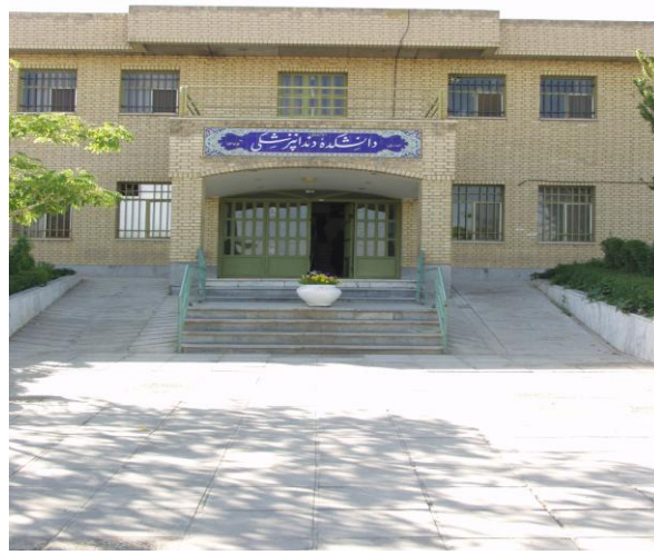
ساختمان دانشکده دندانپزشکی تاسیس ۱۳۷۳