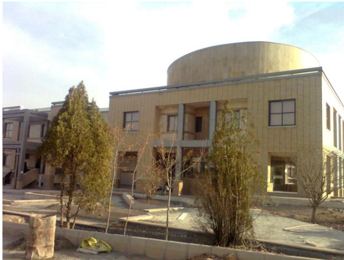
پژوهشکده و کلینیک جامع نگر تاسیس ۱۳۸۹