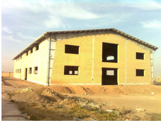
ساختمان در دست اجرای پایلت صنایع غذایی