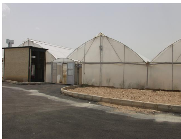
مرکز تحقیقات گلخانه ای تاسیس ۱۳۸۳