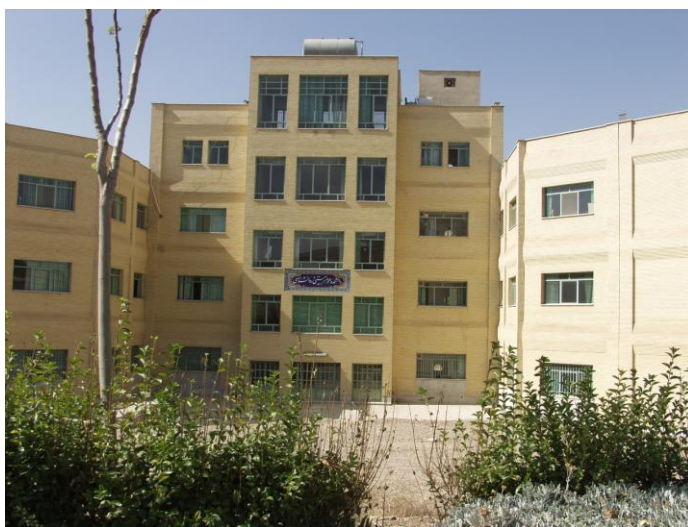
دانشکده علوم تربیتی تاسیس ۱۳۷۹