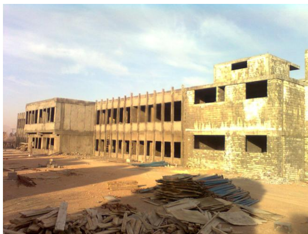
ساختمان در دست اجرای نمایشگاه

احداث ساختمان نمایشگاه بزرگ که تا حد اتمام سفت کاری پیش رفت فیزیکی داشته است، و امید داریم که بتوانیم در سال آینده شاهد بهره برداری از آن باشیم . احداث سوله پایلت صنایع غذایی که تا مرحله سفت کاری پیش رفته است . و همچنین تکمیل پروژه مرکز تحقیقات گلخانه و ساختمان بسیج دانشجویی که در مراحل اتمام پروژه و آماده نمودن جهت بهره برداری می باشد .