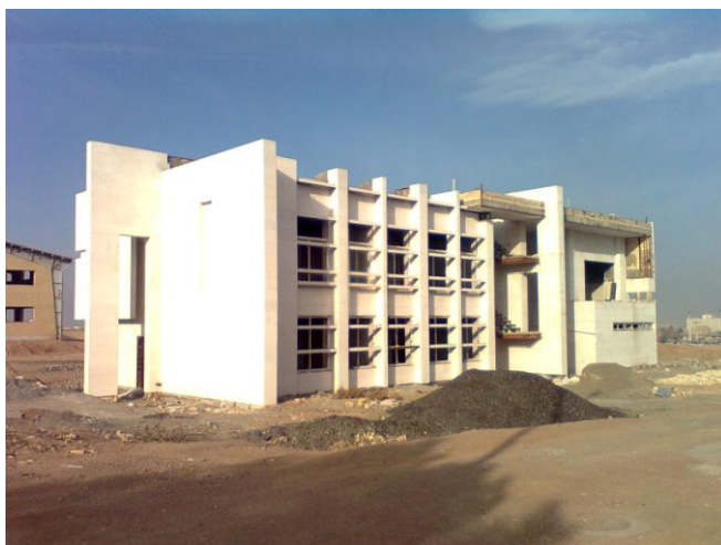
ساختمان در دست اجرای اداری مرکز تحقیقات گلخانه ای