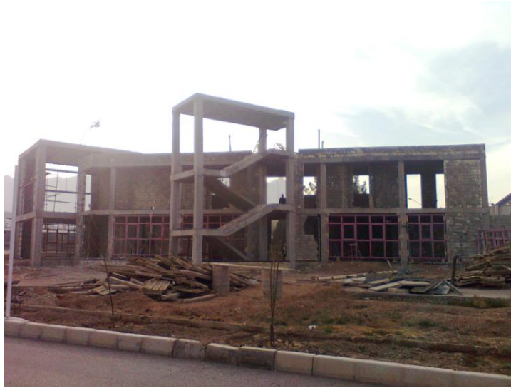
ساختماندر دست اجرای بسیج دانشجویی