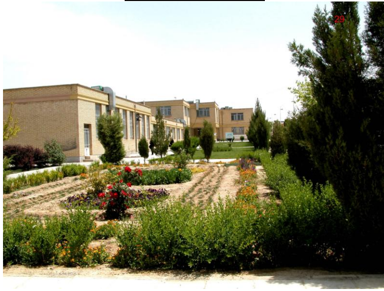
دانشکده کشاورزی تاسیس ۱۳۶۹