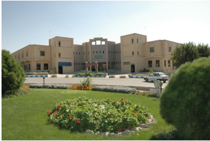
رستوران و مهمانسرا تاسیس ۱۳۷۷