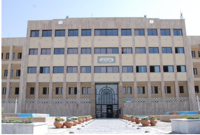
ساختمان اداری مرکزی (اندیشه) تاسیس ۱۳۸۱