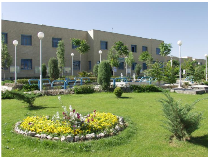
دانشکده فنی و مهندسی تاسیس ۱۳۸۱