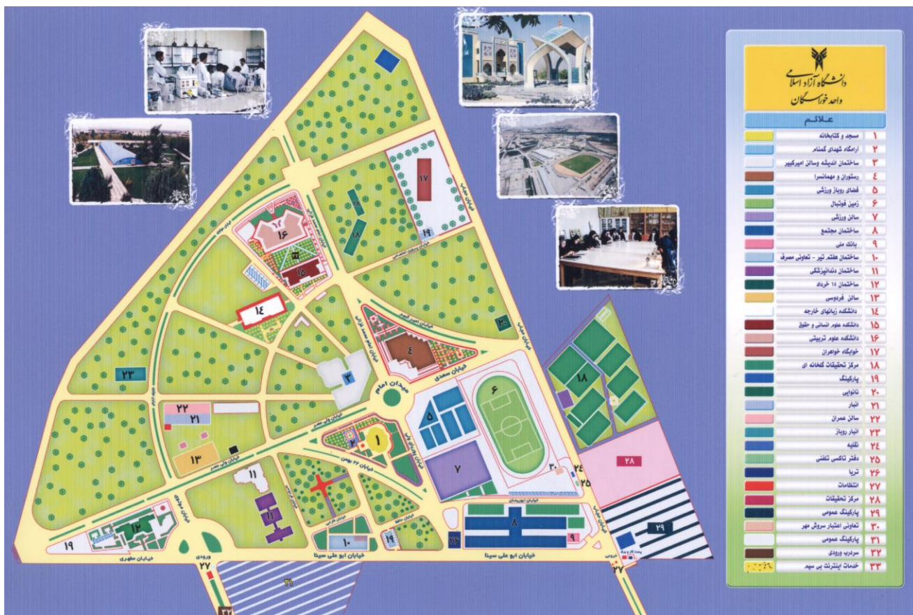
سایت کلی دانشگاه آزاد اسلامی واحد خوراسگان