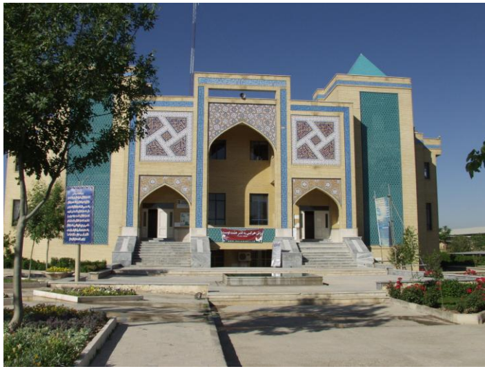
مسجد و کتابخانه مرکزی تاسیس ۱۳۷۵